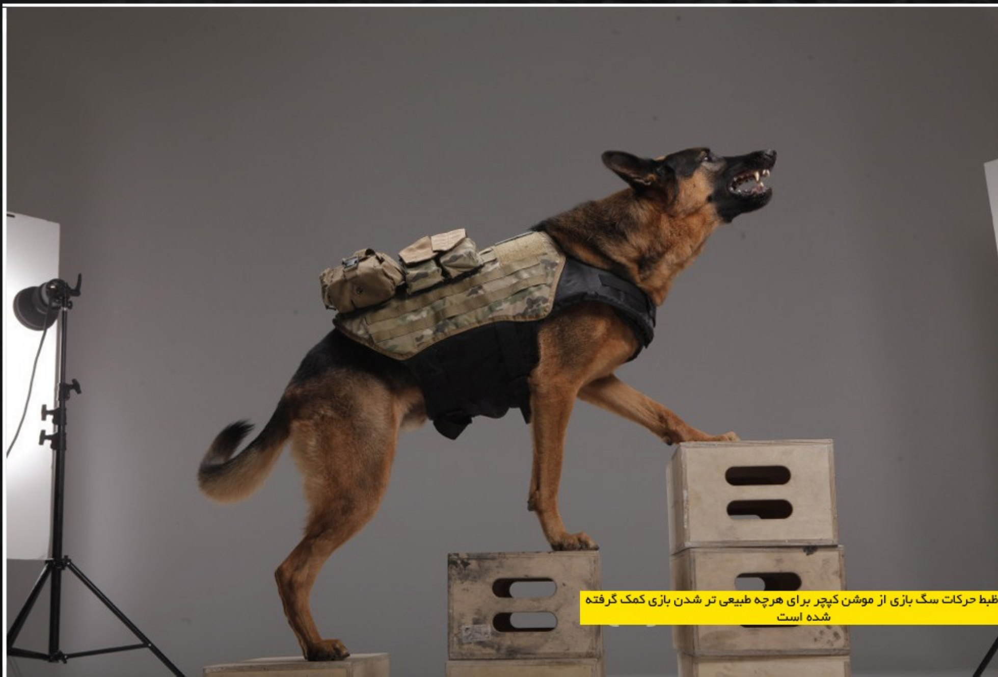
برای ضبط حرکات سگ بازی از موشن کپچر برای هرچه طبیعی تر شدن بازی کمک گرفته شده است

محیط ها نیز علاوه بر تنوع فوق العاده بالایی که دارند، دارای زیبایی منحصر به فردی هستند. شما در بازی شفق های قطبی و ... را می بینید که هر کدام به زیبایی هر چه تمام تر کار شده اند و زیبایی خاصی دارند.